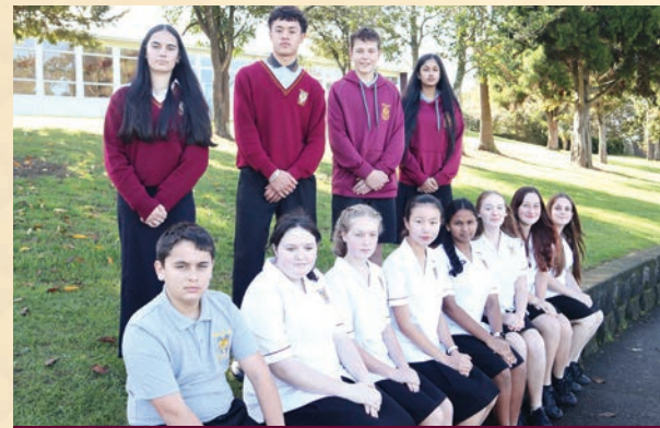
Year 9 - 12 Uniform

怀乌库学院要求学生穿校服。学生在校内、家中和课外活动期间都应该随时穿着校服。有关校服规定的详细信息可以在我们的网站上找到。网址为： www.waiuku-college.school.nz/school-information/uniform/