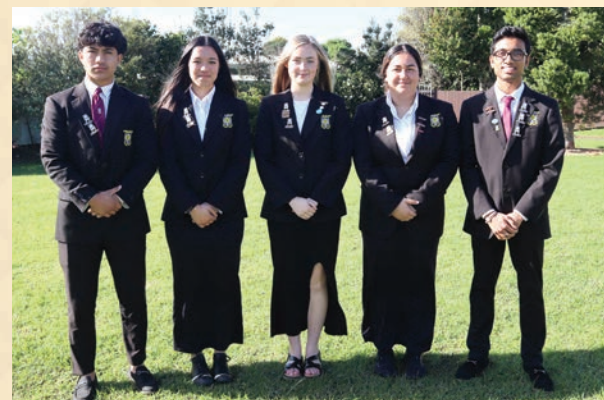
Year 13 Uniform